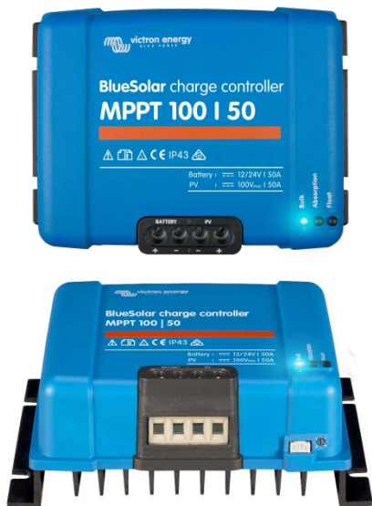
Controlador de carga solar MPPT 100/50