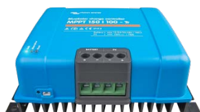
Controlador de carga solar MPPT 150/100-Tr