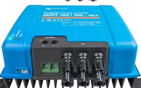
Controlador de carga solar MPPT 150/100-MC4